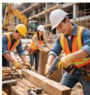
建築現場・作業場